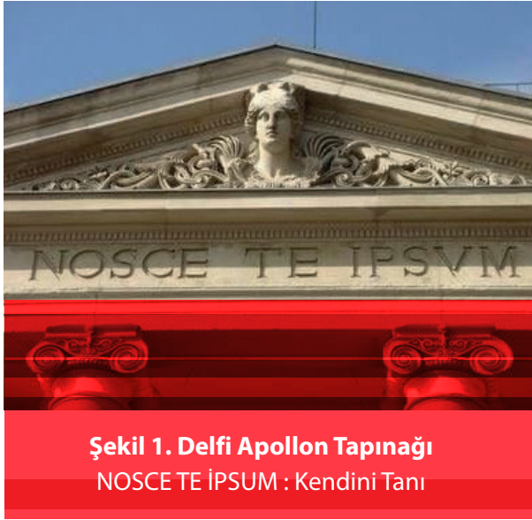
Şekil 1. Delfi Apollon Tapınağı NOSCE TE İPSUM : Kendini Tanı

ğını onun kökleri belirler (Şekil 1). Bireyler ve toplumlar da sağlam değerlere dayanmıyorsa büyük sarsıntılar ve sıkıntılar yaşarlar.