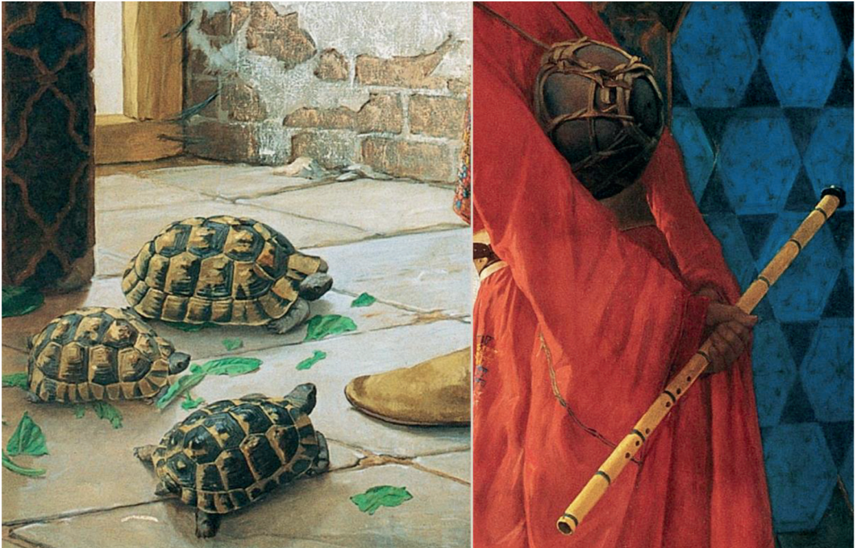
Resim 2: Kaplumbağalar ve sanat aletleri 1.

Dervişin sırtındaki cisim nakkare (kudüm) gibi bir vurmali çalgıdır, elinde ise tekke müziğinin ayrılmaz parçası ney vardır. Boynundan sarkan deriden yapılmış nesne ise maşadır (ya da mızrap), bir iple sırtındaki nakkareye bağlıdır (Resim 2). Adamın ayaklarının altında beş kaplumbağa vardır, önlerinde de atılmış yeşil yapraklar görürüz. Öndeki üç kaplumbağa yaprakları yemekte, arkadaki ikisi ise yiyeceğe yaklaşmaya çalışmaktadır. Mekân ise alçak, tek pencere ve eski, bakımsız bir odadır. Kubbeli ve alçak bu pencere, resmin tek ışık kaynağıdır. Kubbenin üzerinde “Şifa’al-kulûp lika’al Mahbub” yani “Kalplerin şifası, Sevgiliyle (Hz. Muhammed) buluşmaktır” yazılıdır. Eski, boyaları yıpranmış, mavi çinileriyle göze çarpan bir yerdir burası. Bu tanımlamalar bitince doğal olgusal anlam aşaması tamamlanır; bu hâliyle resim kaplumbağalı bir adamı tasvir eden eserdir. Olgusal ifadesel anlam açısından ise dervişin yüz ifadesinin endişeli, düşünceli, belki biraz yıldırgan olduğu söylenebilir. Eğik duruşu da bizde umutsuz ruh hâlinde olduğuna dair bir izlenim