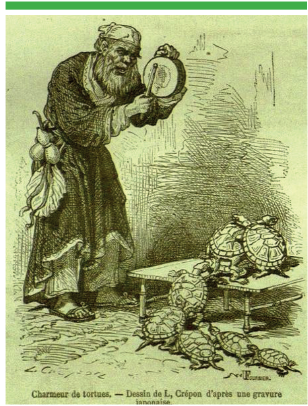
Resim 3: Tour de Monde dergisinde yayımlanan gravür.

yolu bulmaya çalışmaktadırlar. Bu bağlamda kaplumbağa metaforu anlam kazanır; büyük olasılıkla, hantal ve eğitilmeleri zor yapılarıyla dönemin bürokrasisini, belki insanların temsil etmektedirler. Osman Hamdi Bey'in yüzünün pencereye, aydınlığa dönük olması belki batıya olan yönelimini ifade etmektedir. Eğik duruşu ve yüzündeki kaygılı ifadeden, yaşadığı toplumu değiştirme konusunda pek umutlu olmadığı yargısına da varabiliriz. Bulunulan çevre, yani oda da bazı ipuçları taşımaktadır: Yer yer dökülmüş sıvaları ve çinileriyle onarılması gereken bir yapı gibi. Yine yukarıda yazan yazı da, kaplumbağalara iletilmek istenen kutsal mesajı anlatıyor olabilir.