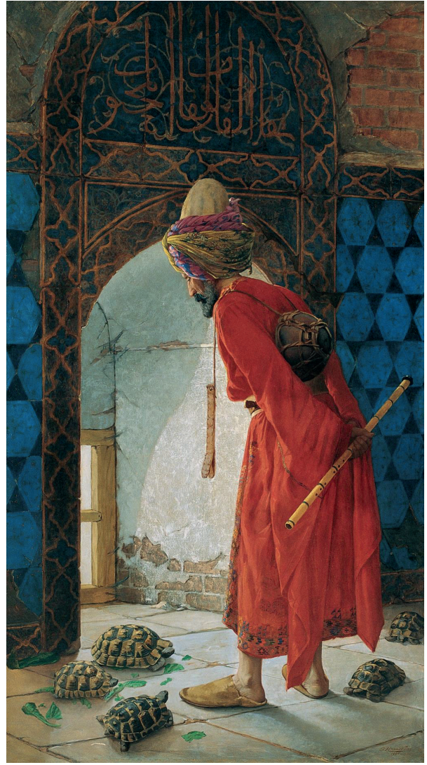
Resim 1: Osman Hamdi Bey, Kaplumbağa Terbiyecisi. 1906, Tuval üzerine yağlıboya, 221,5 cm x 120 cm, Pera Müzesi.

Osman Hamdi Bey (1842 – 1910) Kadıköy'ün ilk belediye başkanı, arkeolog, diplomat, bürokrat, müzeci ve ressamdır. Bugünkü Mimar Sinan Üniversitesi Güzel Sanatlar Akademisini (Mekteb-i Sanayi-i Nefise-i Şahane) o kurmuştur. Hukuk eğitimi için gittiği Paris'te resim eğitimi de gören Osman Hamdi Bey, bugün daha çok ressam kimliği ile hatırlanmaktadır. Onun en bilinen eseri olan "Kaplumbağa Terbiyecisi" adlı tablosunu Panofsky'nin yöntemi ile analiz etmeye çalışalım. Yorumu yapılacak bu resim bugün Pera Müzesinde sergilenmektedir. Resam bir yıl sonra daha küçük boyutlu ikinci bir