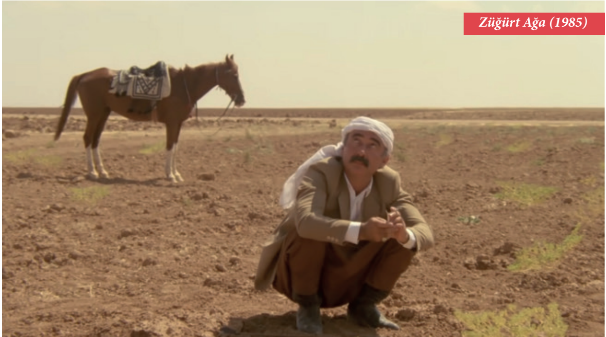
Züğürt Ağa (1985)

Toprağın insanları şehirlere kustuğu bir dönemde, Züğürt Ağa, kendi ifadesiyle “ biraz da şan şöhret için yaşayan ” bir feodal. Trajik olan ise, böyle bir geçiş döneminde geçmişle gelecek arasında sıkışıp kalması. Belki de düşüşünü izlemekten keyif alacağımız bir figürken, ayakta kalmak için verdiği her çırpınıştaki izlediğimiz ‘acınacak kadar komik olma’ hali sanıyorum Şener Şen’in müthiş oyunculuğunun başarısıdır. Güreş tutkusu tatmin olsun da ziyafet versin diye marabalar, köye gelen pehlivanları Ağa’ya yenilmesi için tembihler mesela. “Teyatro” hâline gelmiş psödogalibiyetlerinden sonra “siz de beni Sultan Aziz mi sandınız?” diye böbürlenen, keyiflenen bir insan işte bakınca. Belki de görüldüğü gibi olmasıdır izlerken onunla özdeşlik kurmamızı sağlayan şey. Böyle gözükebilmesi tek başına Şener Şen’in oyunculuk başarısıyla açıklanamaz, çünkü Ağa da her muktedir gibi şu şans ve imkânlarla sahiptir: “... iktidar rol yapmak zorunda olmamak anlamına gelir, daha doğrusu tek başına herhangi bir gösteri konusunda daha kayıtsız ve ilgisiz olma kapasitesi demektir” (4).