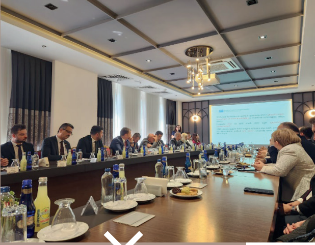
Adana Bağımlılık İle Mücadele İl Koordinasyon Kurulu toplantısında