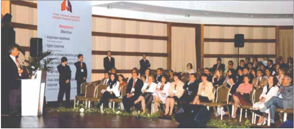
Prof. Dr. Haluk Türктаş 9. Kongre açılış konuşmasını yapıyor

Kongremize toplam 1026 bildiri gönderilmiş ve bunların 946'sı değerlendirilmeye alınmıştır. Kongre boyunca çeşitli solunum sistemi hastalıklarına ilişkin gerek ülkemiz, gerekse bölge ülkelerinden gönderilen 808 araştırmanın sonuçları mini sempozyum (80), tartışmalı poster (428) ve poster oturumlarında (300) bildiri olarak sunulmuştur. (şekil 1-2)