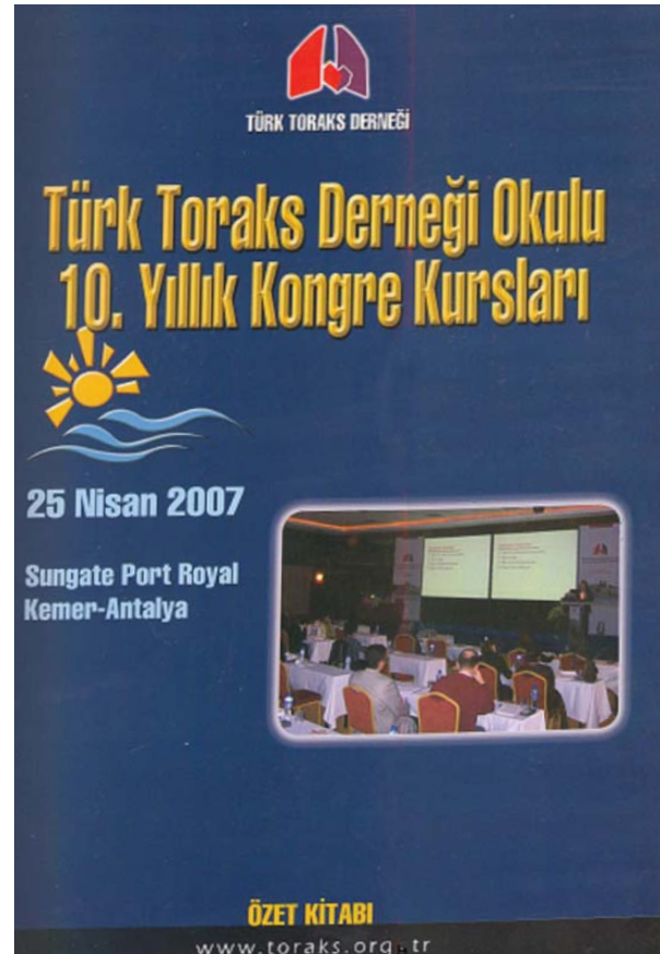
Resim 2. TTDO 10. Kongre Ders Kitabı