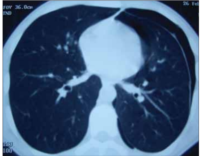
Resim 4. Pnömotoraks BT görüntüsü