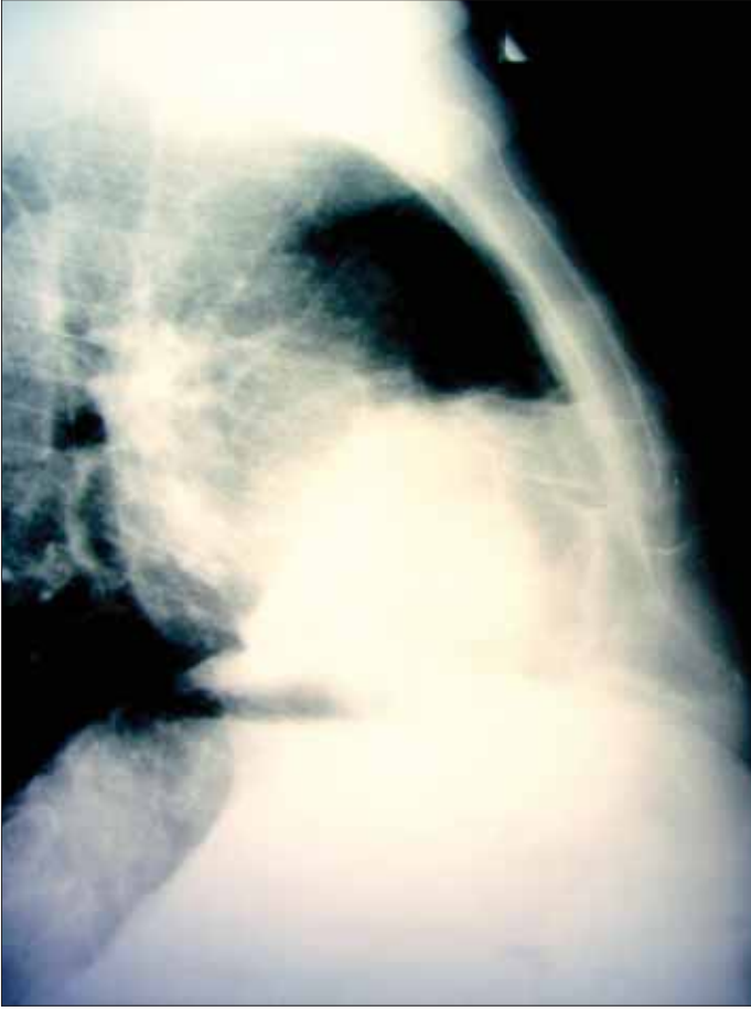
Resim 10. Travma sonrası sternum fraktürü

türlerinde operatif yaklaşım özellikle ağrı ve kozmetik nedenlerle önerilmektedir. Operasyon, sinusitoz oluşmadan 1-2 hafta içinde yapılmalıdır.