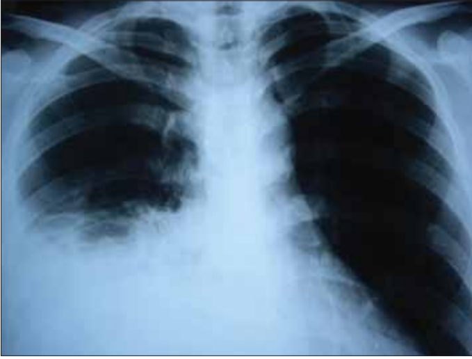
Resim 5. Travma sonrası hemotoraks

ğu, trakeanın karşı tarafa itilmesi, solunum seslerinin yokluğu ve perküsyonda hiperrezonans saptanır. Tedavisinde tüp torakostomi uygulanır.