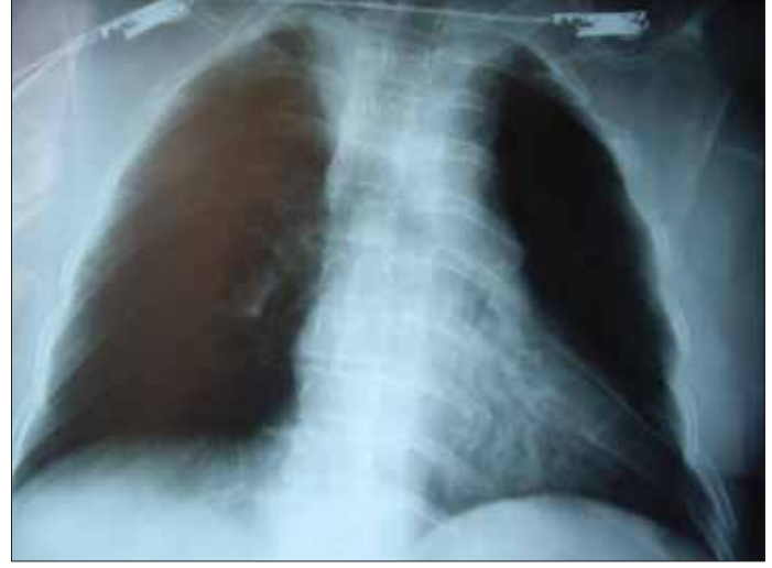
Resim 7. Travma sonrası kontüzyon

Kalp tamponadı şüpheli durumlarda; santral venöz basınçta artma, hipotansiyon, kalp seslerinde derinleşme gözlenir. Cerrahi dekompresyon acildir. Gözlem altında tutulan