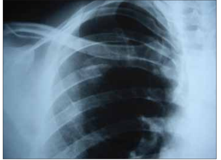
Resim 9. Kosta fraktürü