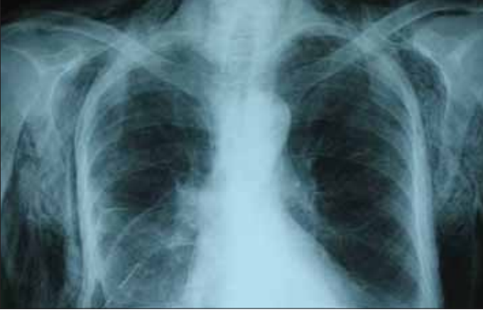
Resim 2. Cilt altı amfizem akciğer grafisi

yonunda venöz akımın yukarıdan kalbe dönüşünün bozulmasına bağlı olarak üst göğüs kafesi, yüz ve kollarda peteşi, üst tarafta masif ödem ve hatta serebral ödem, bunların dışında ilgili tarafta solunum seslerinde azalma, perküsyonla hiperrezonans alınması altta yatan patolojiler ile ilgili olarak yol gösterici bulgular olabilir. Birinci ve 2. kosta fraktürleri, sternal fraktür, mediasten genişlemesi, yelken göğüs, masif hava kaçağı, hemoptizi, masif hemotoraks, boyun ven distansiyonu, künt diyafragma yaralanması majör yaralanma göstergeleridir (6,9).