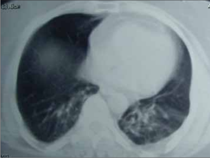
Resim 8. Akciğer kontüzyonu BT görüntüsü

Servikal olabildiği gibi toraks travması ile de karşılaşabileceğimiz özofagus yaralanması; sıklıkla penetrandır, kosta fraktürü olmadan sol pnömohemotoraks, alt sternum veya epigastriyuma künt travma sonrasında şok, toraks tüpünden partiküllü içerik gelmesi, mediastinal hava varlığı klinik bulgulardır. Cerrahi tedavide, ilk 24 saatteki erken tanı konulan olgularda yaklaşım; torakotomi ile primer onarım ve drenaj olmakla birlikte geç tanı konulan olgulardaki tedavi yaklaşımı değişkenlik göstermektedir. Pnömotoraks, pnömoperitoneum, mediastinal amfizem, sepsis, şok, solunum yetmezliği, medikal tedavi sonrası gelişen abse ve ampiyem operasyon için mutlak endikasyonlardır. Özofagus üst 2/3 bölge perforasyonlarında sağ torakotomi, alt 1/3 bölge perforasyonlarında ise sol torakotomi ile girişim uygulanır. Abdominal özofajiyal perforasyonlarda ise laparotomi gerekebilir.