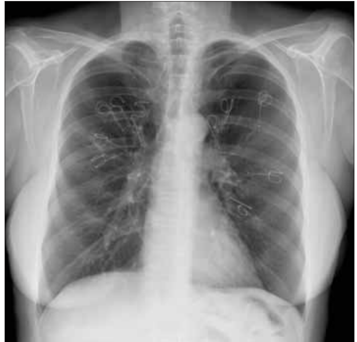
Resim 3. Üst loblara bilateral coil yerleştirilmesi sonrasında hastanın akciğer grafisi

PneumRx akciğer volüm küçültücü teller (PneumRx, Inc, Mountain View CA, USA) nitinol tellerden oluşmuş olup bunlar açıldıktan sonra parankimde kompresyon yaratacak bir biçim alacak şekilde önceden yerleştirilmişlerdir (resim 3). Bu teller kendilerine uygun bir taşıyıcı sistem kullanılarak bronkoskopik olarak yerleştirilmektedir. İlk önce seçilen segmentteki havayolu bronkoskopik olarak belirlenir ve direnci düşük olan kılavuz tel floroskopi altında