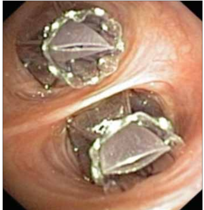
Resim 1. Sol üst loba yerleştirilmiş endobronşial valvler