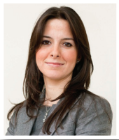
Dr. Leyla PUR ÖZYİĞİT