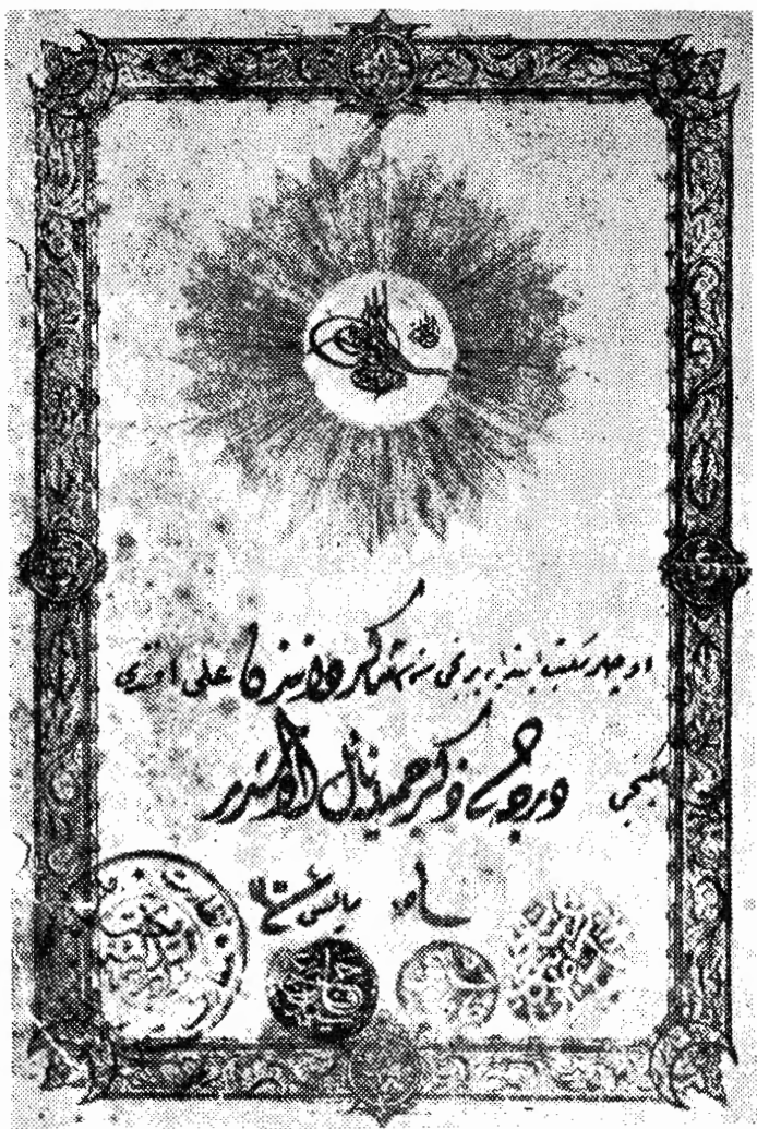
Gülhane Staj Vesikam