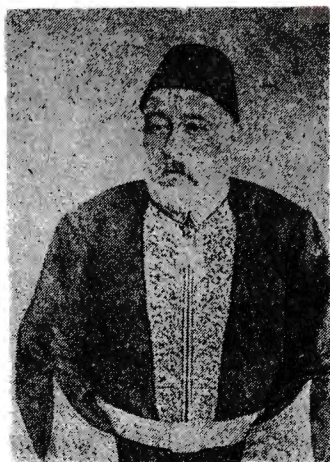
Babası Salim Bey