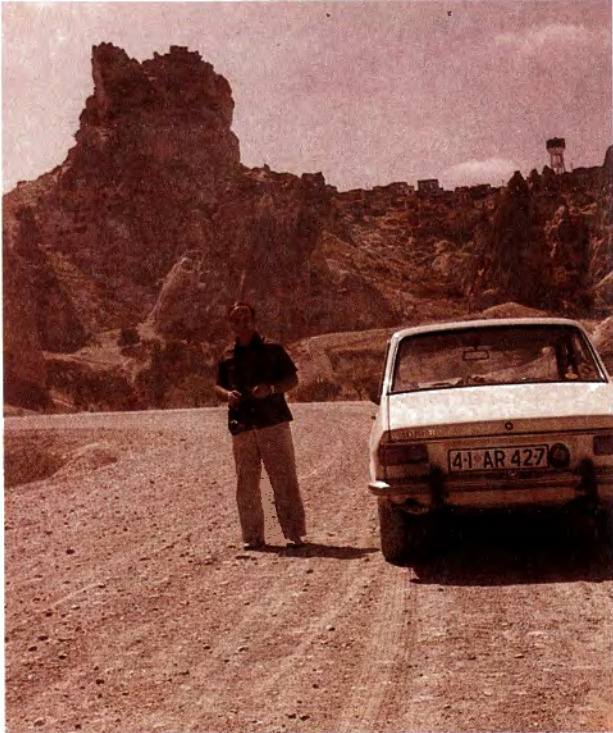
Resim 2 : Arap atı: 41-AR-427 Göreme'de