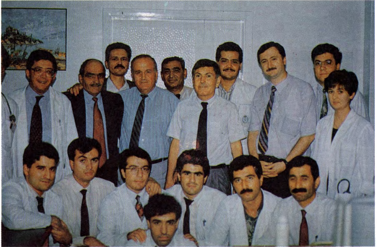
Resim 8 : Ailemiz büyüdü. Eski ve yeniler bir arada.