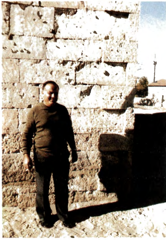
Resim 3 : Zeolitli taşlardan yapılmış Karain Köyü Kütüphanesi önünde. Köye gelen yabancı bilim adamları bu taşlardan kopardıkları parçaları hatıra olarak almışlardı.