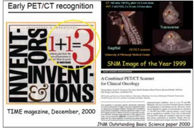
Resim 7. PET/BT ilgili ilk yayınlar. (TIME, December 4, 2000)

Maria Sklodowska Curie'nin yaptığı çalışmaları başlayan radyoaktif elementi saflaştırma çalışmalarının yanısıra yapay olarak radyonüklid üretimi için de önemli çabalar gerçekleştirilmiştir. Bu çabalar süresince yapay bir radyonüklid üretebilmenin tek yolunun kararlı olan bir atomun yörüngesindeki elektronların veya çekirdeğindeki parçacıkların dengesinin bozulması olduğu anlaşılmıştır. Özellikle kararlı bir atomun çekirdeğine subatomik bir partikülü yerleştirebildiğiniz zaman kararlı olmayan, radyoaktif bir atom elde edilebilmektedir. Bu yöntemin uygulanabildiği cihazlar ise partikül hızlandırıcılar olmuştur. Başlangıçta çizgisel olan hızlandırıcılar, daha sonra dairesel şekilde dönüştü-