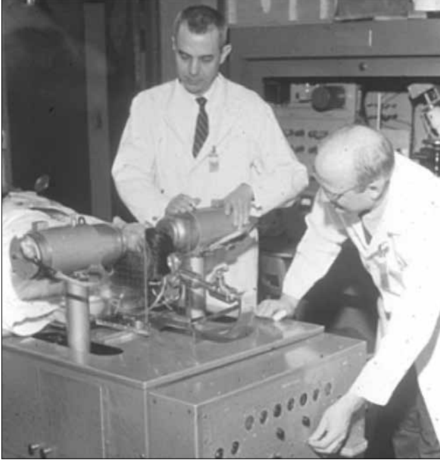
Resim 4. İlk klinik pozitron görüntüleme cihazı. Dr. Brownell (solda) ve Dr. Aronow.

fik olarak beyin görüntülemeye kullanılacak bir cihazın geliştirilmesini tetikledi. Yeni cihaz hem rastlantısal görüntüleme ve hem de dengesiz görüntüleme yapabilecek şekilde tasarlandı. Dengesiz, yani tek detektöre dayanan görüntü düşük çözünürlük içermekle birlikte tümörün varlığını ve orta hattın sağında mı solunda mı olduğunu anlamak için çok duyarlı idi.