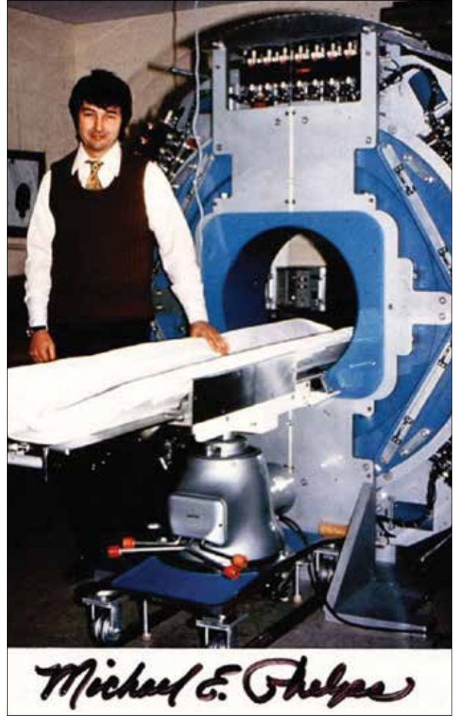
Resim 6. Michael Phelps ve Pozitron Tomografi Cihazı

Bütün bu olaylar modern PET gelişiminin başlangıcı olarak kabul edilir. Gelişmeye ilişkin basit bir karşılaştırma gerekirse PET II ve PET III'te 50 mm boyutundaki