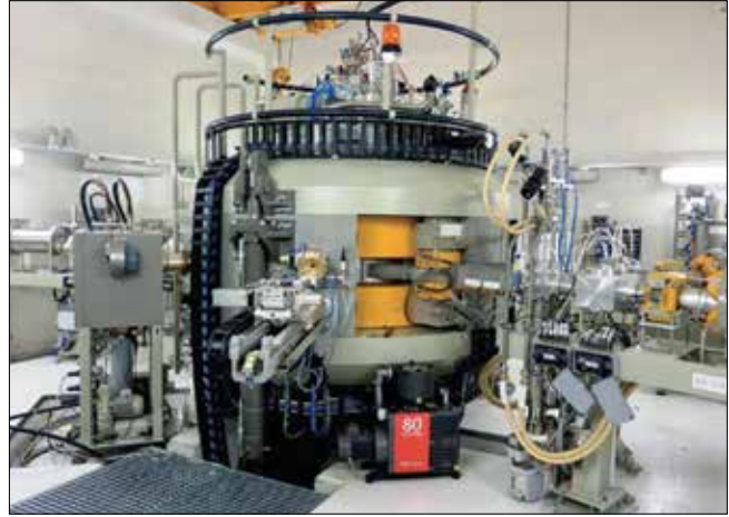
Resim 2. IBA'nın ilk siklotronu Cyclone-30