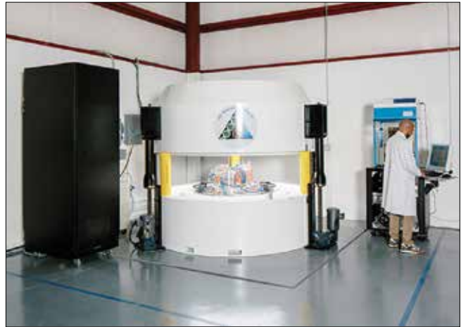
Resim 3. ABT Molecular Imaging Inc. şirketi tarafından 7,5 MeV enerjide proton hızlandırıcı ve tek hastalık 18 Flor üreten siklotron ( http://abt-mi.com/ )

Laboratory (PRL), Gordon L. Brownell'in yönetimi altında yapılandırıldı. Beyin Cerrahisi servisinin de katkıları ile 6 ay içerisinde karşıt iki NaI (TI) detektör kullanan basit bir pozitron tarayıcı üretildi. Hemen şüpheli bir beyin tümörü olan hasta görüntülendi. Böylece pozitron ile ilk tıbbi uygulama yapılmış oldu. Sonuç o kadar olumlu oldu ki beyin tümör lokalizasyonu Sweet tarafından yayın haline getirildi. Bu yayın 1951 Aralık ayında New England Journal of Medicine'de yayınlandı (Resim 4).