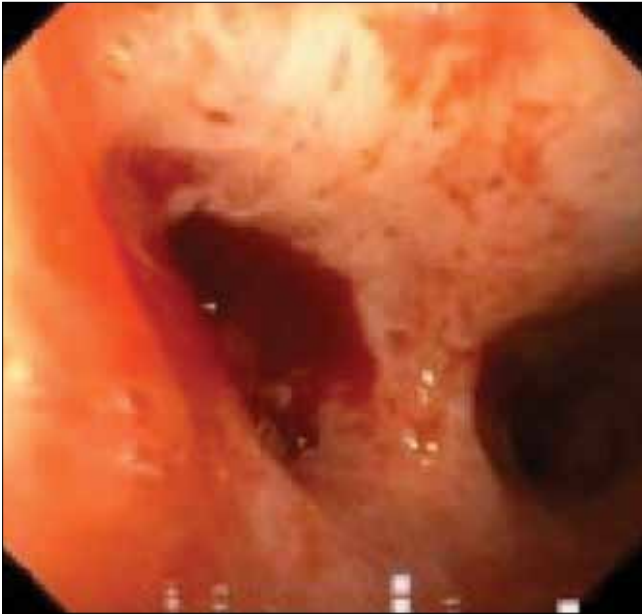
Resim 3. Bronkoscopide sol ana bronş kaynaklı tümoral lezyona bağlı hemoptizi odağı