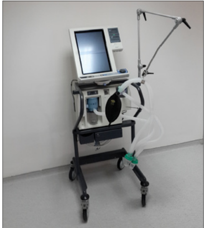
Resim 2. Modern bir ventilatör cihazı

lerde hava yolu basıncının çok artması durumunda inspirasyonda gaz akımının kesilmesini ve geriye kalan verilmemiş tidal volümün atmosfere çıkmasını böylece hava yolu basıncının tehlikeli düzeye çıkmasını önleyen emniyet sistemleri mevcuttur. Akut solunum yetmezliğinde belirlenen dakika hacminin hastaya verilmesini garanti etmesi nedeniyle volüm ayarlı ventilasyonun uzun süre en uygun seçenek olduğuna inanılmıştı. Günümüzde ise volüm ayarlı ventilasyonun, akciğerin mekanik özellikleri değiştiğinde yüksek inf-lasyon basınçları oluşturarak barotravmaya yol açtığı