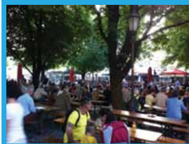
Resim 2. Viktualienmarkt'tan bir görünüm

Gastronomi açısından Münih mutfağı genellikle et ağırlıklıdır. Domuz eti yemekten çekinmeyenler için sosisler denenebilir. Özellikle Weisswurst Münih'e has bir sosistir. Münih'te kaçırmamanız gereken yer, Hofbrauhaus'ta tavuk (Hendl) yemekdir. Bu kadar lezzetli tavuğu ne yazık ki ülkemizde bulamıyorum artık. Yemek esnasında geleneksel Bavyera müziği de eşlik eder size. Ayrıca geyik eti ve şişte alabalık da deneyebileceğiniz lezzetlerdendir. Münih'te içine koruyucu madde eklenmeyen sayısız çeşitte bira vardır, Weissbier denen buğday birası özellikle meşhurdur. Münih'in meş-