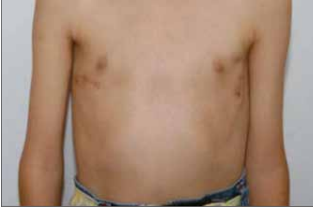
Resim 1. Post operatif görünüm

Ortalama ameliyat süresi 40 dakika (28-56 dakika), kanama miktarı ortalama 15 ml idi. Cerrahi sonrası iki hastada (%3.7) pnömotoraks görüldü. Sağ %10 pnömotoraks gelişen bir hastada izleminde pnömotoraks kendiliğinden rezorbe oldu. Ravich operasyonu sonrası Nuss yöntemi uygulanan 6 hastanın 3'ünde pro-